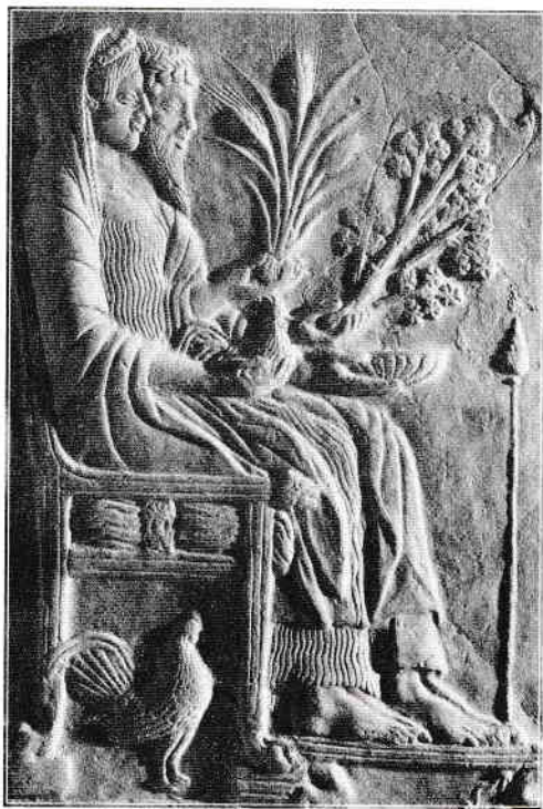
HADES ȘI PERSEFONA

răspândit cultura grâului și cel dintâi pontif al zeiței. Astfel se conturează cele două caracteristici ale religiei de la Eleusis: rituri agrare și speranțe pentru viața de dincolo de mormânt.