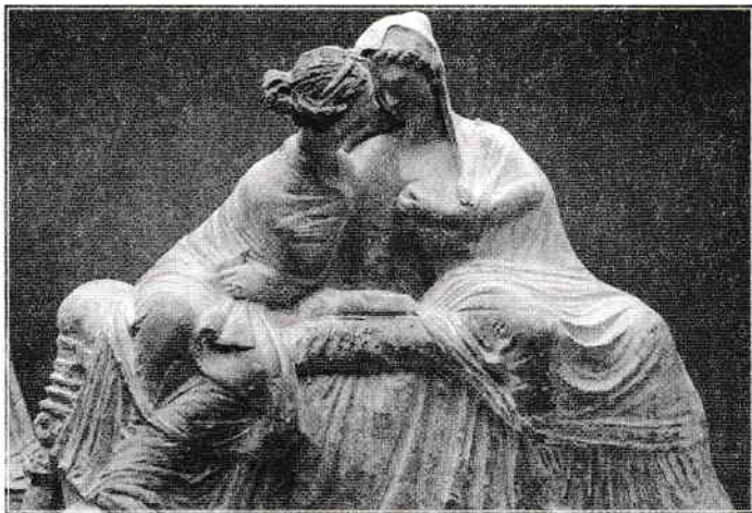
DEMETER ȘI PERSEFONA (CERAMICĂ DE TANAGRA)

mult mai prozaic, acela de a trece dincolo de aparențe pentru a vedea ce se ascunde în spatele lor 1 .